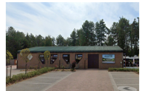
O.C. Buurthuis Veerle-Heide