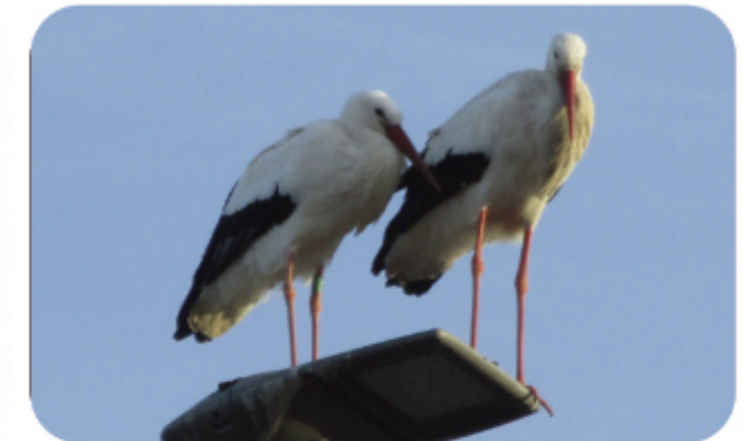
Deze ooievaars zwaaiden ons uit na de controle