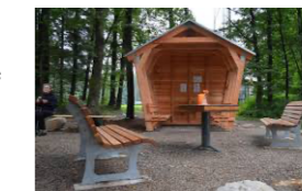
Neue Begegnungsstätte am Fußballplatz Medell

Veranstalter / Organisateur / Organisation: Wanderclub AMEL Strecken / Distances / Afstanden: 4 - 6 - 12 - 21 km Start und Ziel / Départ et arrivée / Vertrek en aankomst: Schützenhalle / Hall de tir "St. Hubertus" Medell, Zur Heide 17 - 4770 MEDELL Startzeiten / Horaire / Starttijden: 7.00 - 14.00 Uhr / heures / uur Kontrollschluss / Fin de contrôle / Laaste aankomst: 17.00 Uhr / heures / uur Startgeld / frais d'inscription / Deelnemingskosten: 1,00 € mit Stempel / avec estampille - met stempel Einschreibung und Auskünfte / Inscription et renseignements/ Inschrijving en inlichtingen: THEISS Gisela An Brühl 6 4770 HALENFELD Tel. 080 / 34 90 52 - 0470 937 818 HILGERS Hilde Betscheid 49 4770 HEPPENBACH Tel. 080 / 34 93 66