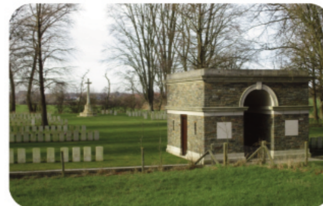
Maple Corse Cemetery