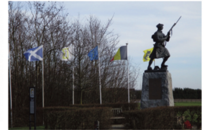
Black Watch Corner3