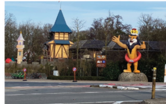
Dicht bij de controle in Bellewaerde