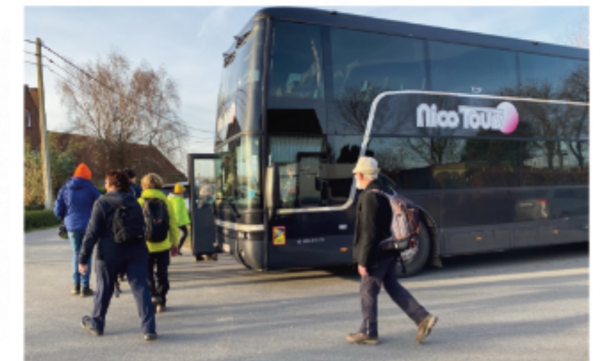
Naar huis na een mooie tocht op een zonnige winterdag