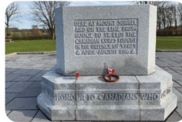
Canadees monument op Hill62