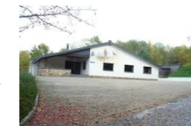
Schützenhaus St. Hubertus Medell

Herzliche Einladung an alle Wanderfreunde aus nah und fern.